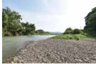
【ロケ地②】 高屋川河原（富田） 川遊びシーンの撮影