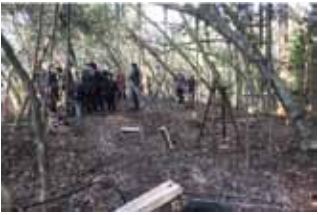
【ロケ地③】 須知高校学校林 疎開先での遊びシーンの撮影