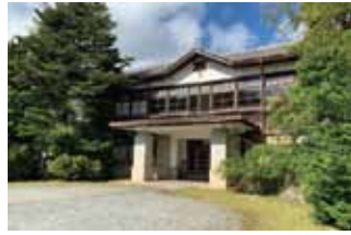
【ロケ地④】 旧須知小学校 愛育隣保館シーンの撮影