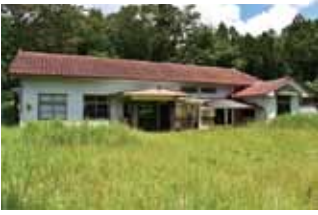
【ロケ地①】 質美保育所 戸越保育所シーンの撮影